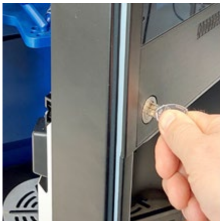
Open de deur van de machine.