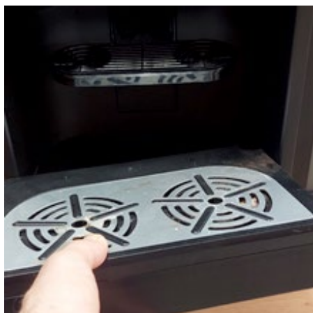
Bij herstart loopt er water uit de uitloop. Leeg de lekbak.