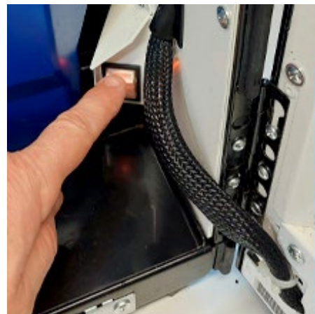
Schakel de machine uit- en weer aan.