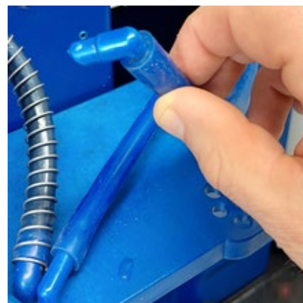
Lijkt een uitlooptuitje niet geheel rechtstandig te zijn geplaatst? Corrigeer door het uitlooptuitje uit de houder te nemen.