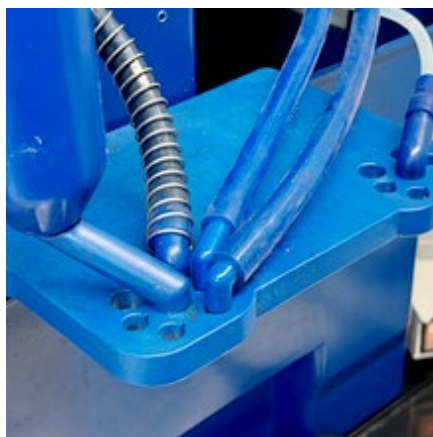
Controleer of alle uitlooptuitjes geheel verticaal en correct in de uitgiftehouder zijn gedrukt.