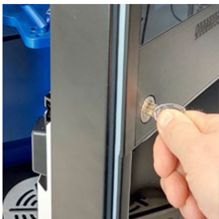
Open de deur van de machine.