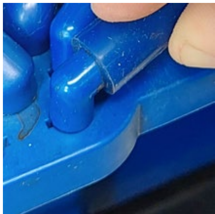
Plaats het uitlooptuitje daarna rechtstandig in de uitgiftehouder.